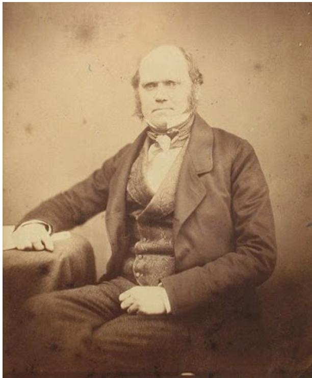
Charles Darwin (1855)

BLUSHING is the most peculiar and the most human of all expressions.